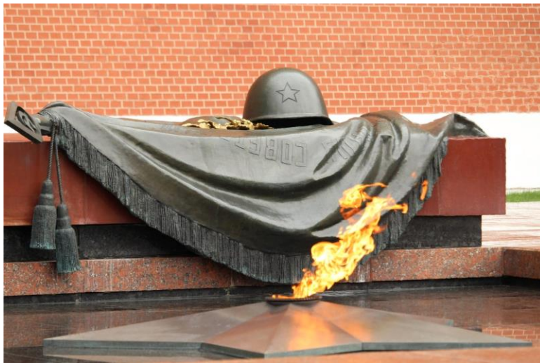
Могила Неизвестного Солдата