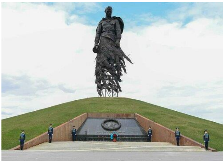
Ржевский мемориал Советскому войну