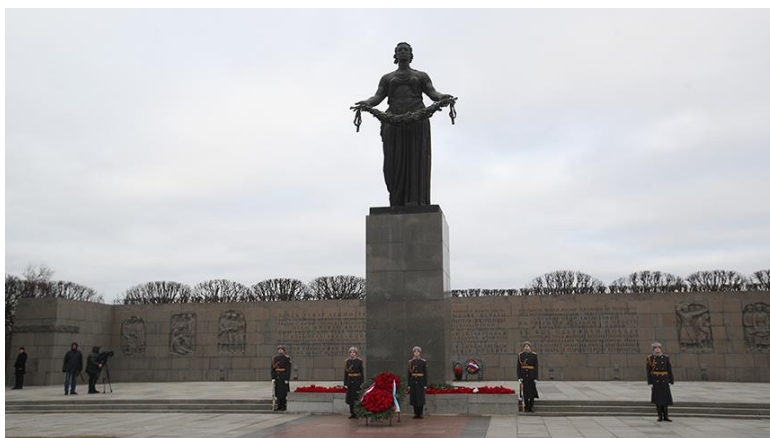
Пискаревское мемориальное кладбище, Санкт-Петербург