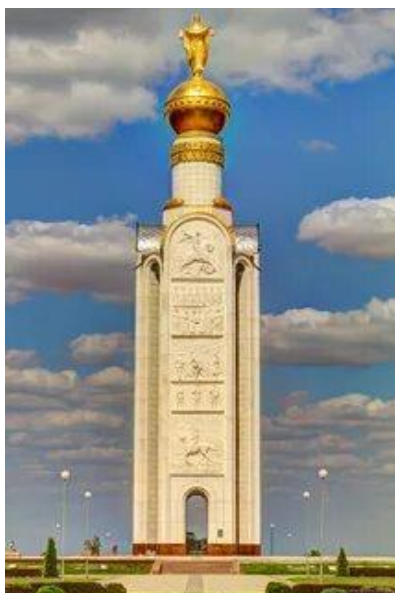
Памятник Победы – Звонница. Прохоровка