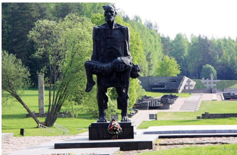
Скульптура Непокорённого человека. Хатынь