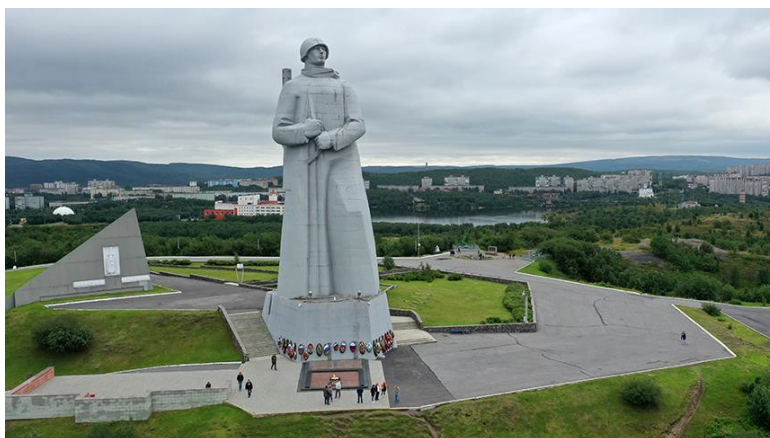
«Защитникам Советского Заполярья в годы Великой Отечественной войны», Мурманск